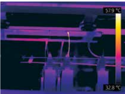
Trasformatore surriscaldato di un elettrodotto