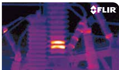
Immagine termica di una sottostazione.

FLIR A310 può essere fornita già integrata in una custodia ambientale. Per effetto di questa custodia le specifiche ambientali del modello FLIR A310 raggiungono il grado di protezione IP66, senza tuttavia limitare le funzionalità della termocamera. Questa opzione si rivela estremamente utile per installare la termocamera in ambienti polverosi o umidi. La custodia è disponibile per le termocamere A300 dotate di obiettivo con FOV 7, 15, 25, 45 o 90°. La custodia può essere ordinata separatamente dagli utilizzatori che preferiscono installare personalmente la termocamera nella custodia o che posseggono già un modello FLIR A310 che richiede una protezione superiore contro polvere ed acqua.